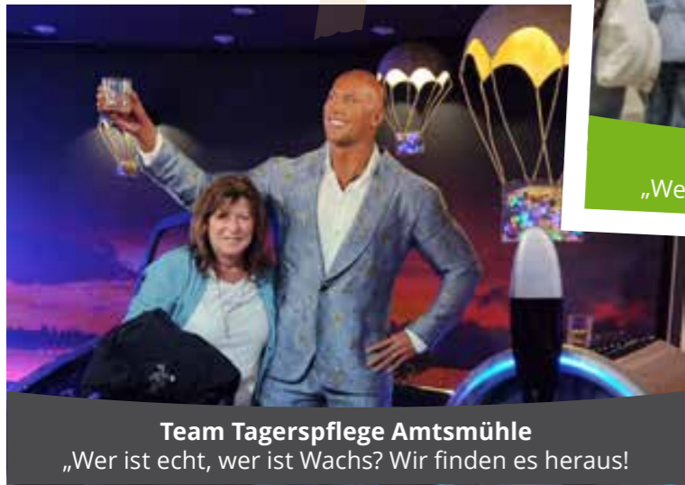
Team Tagerspflege Amtsmühle „Wer ist echt, wer ist Wachs? Wir finden es heraus!“