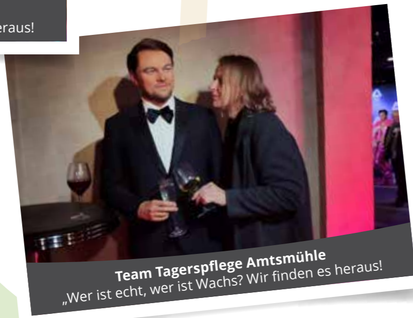
Team Tagerspflege Amtsmühle „Wer ist echt, wer ist Wachs? Wir finden es heraus!“