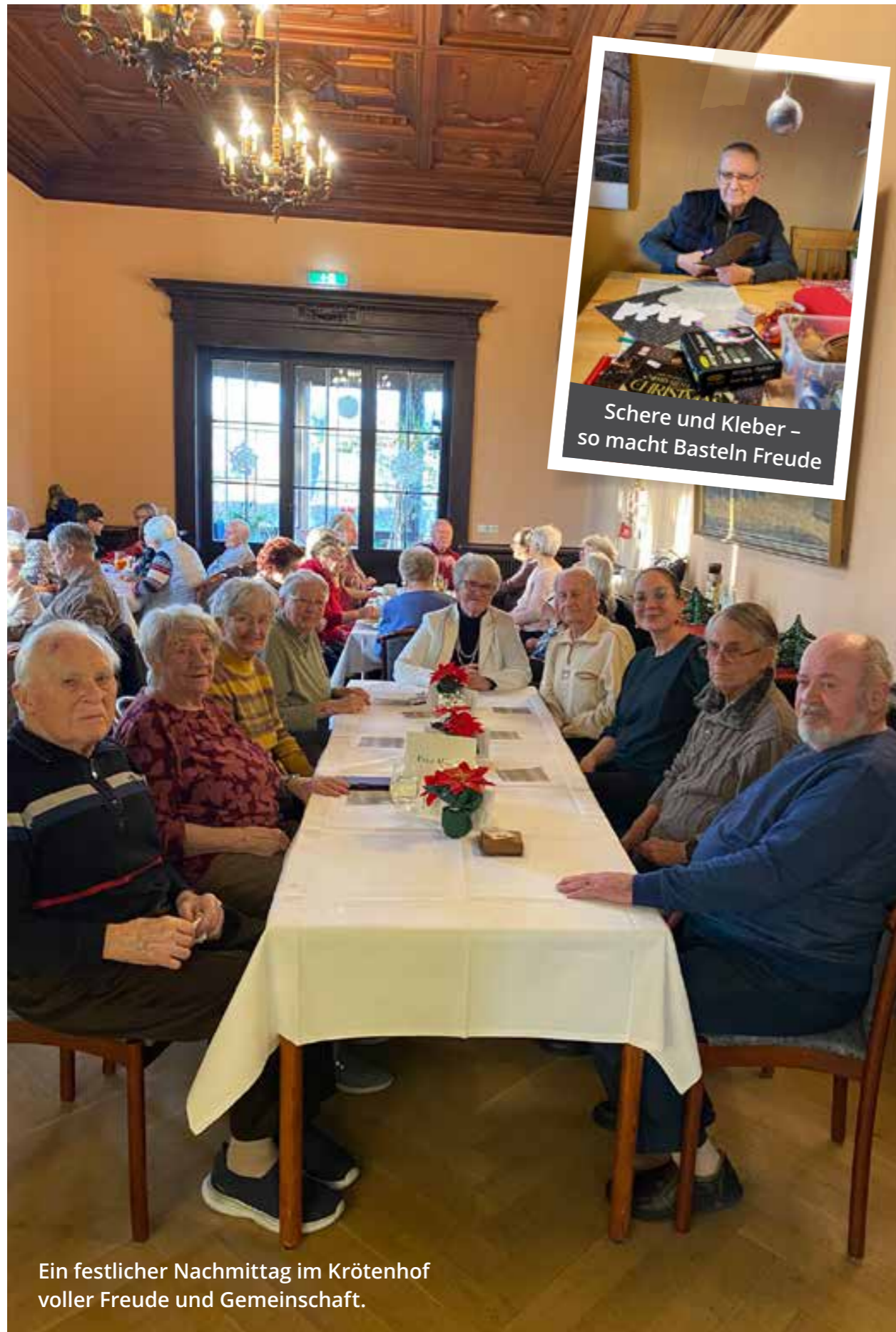
Ein festlicher Nachmittag im Krötenhof voller Freude und Gemeinschaft.