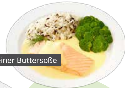
Lachsfilet in feiner Buttersoße