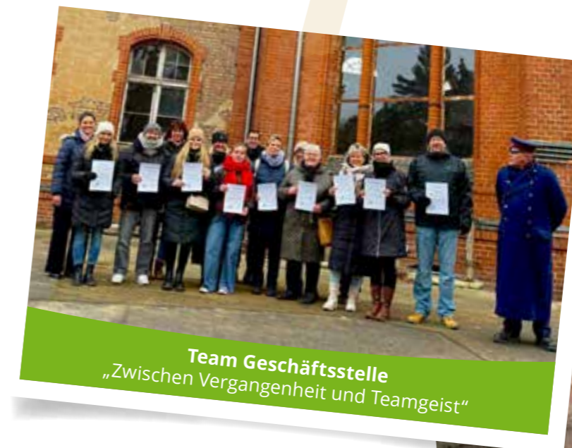
Team Geschäftsstelle „Zwischen Vergangenheit und Teamgeist“

tiv oder einfach gemütlich – diese Momente verbinden, schaffen Vertrauen und bleiben im Kopf. In dieser Rubrik blicken wir zurück auf besondere Erlebnisse, teilen Eindrücke und zeigen, wie viel Teamgeist in der VS92 steckt.