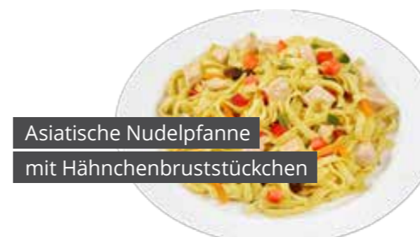
Asiatische Nudelpfanne mit Hähnchenbruststückchen