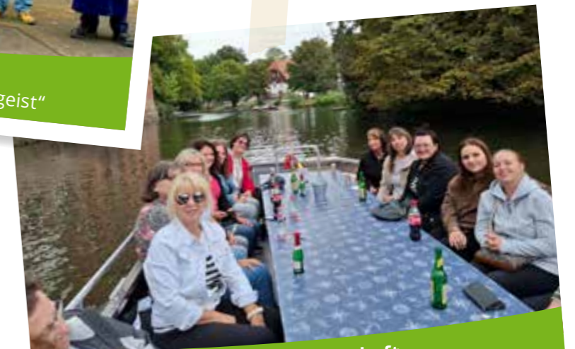
Team Hauswirtschaft „Leipzig, wir kommen. Teamgeist im Gepäck“