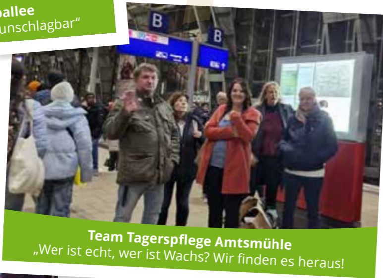
Team Tagerspflege Amtsmühle „Wer ist echt, wer ist Wachs? Wir finden es heraus!“