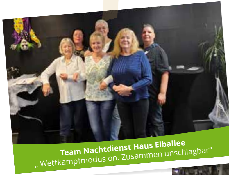
Team Nachtdienst Haus Elballee „Wettkampfmodus on. Zusammen unschlagbar“